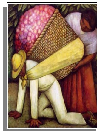
Le porteur de fleurs de Diego Rivera