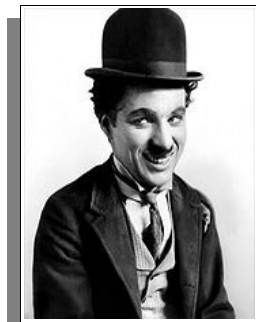
Le personnage de Charlot