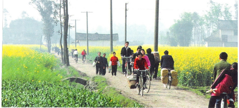
Paysage n°2 : campagne du Sichuan