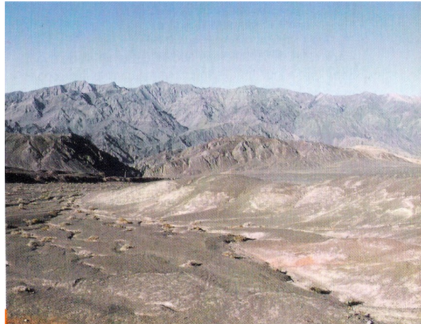
Paysage n°3 : Dans le désert de Gobi

1. Quels types d'espaces sont ici occupés ?