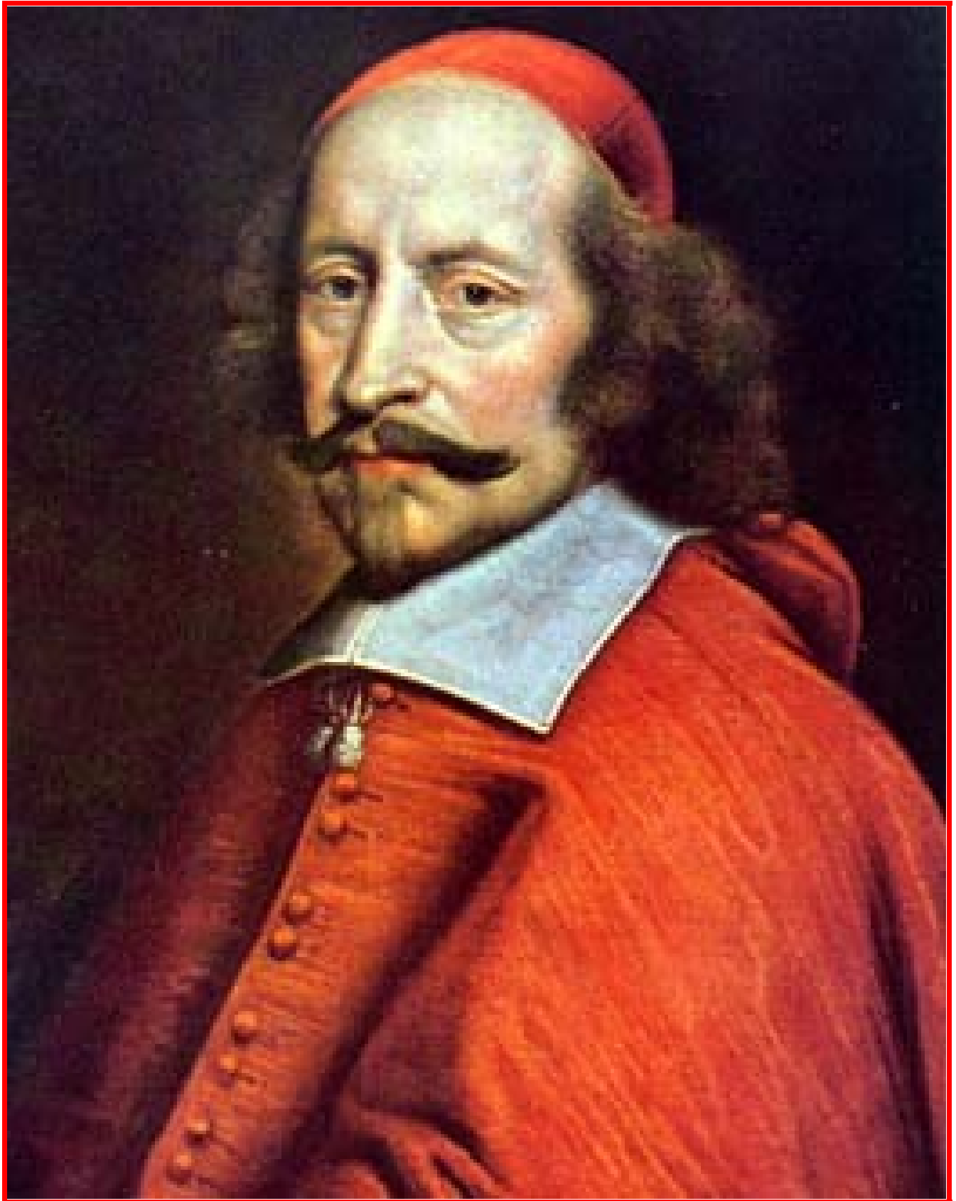
Le cardinal Mazarin ( 1602-1661)